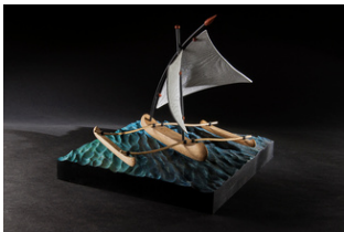
Cap de Huesta

Plus d'infos en contactant Thierard10@gmail.com